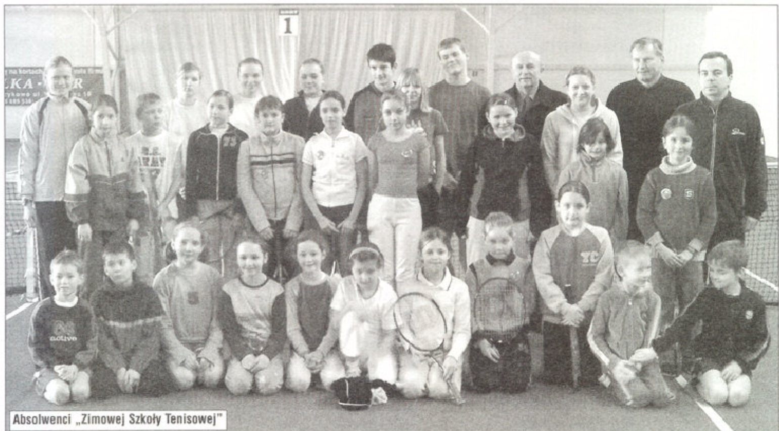
Absolwenci „Zimowej Szkoły Tenisowej”